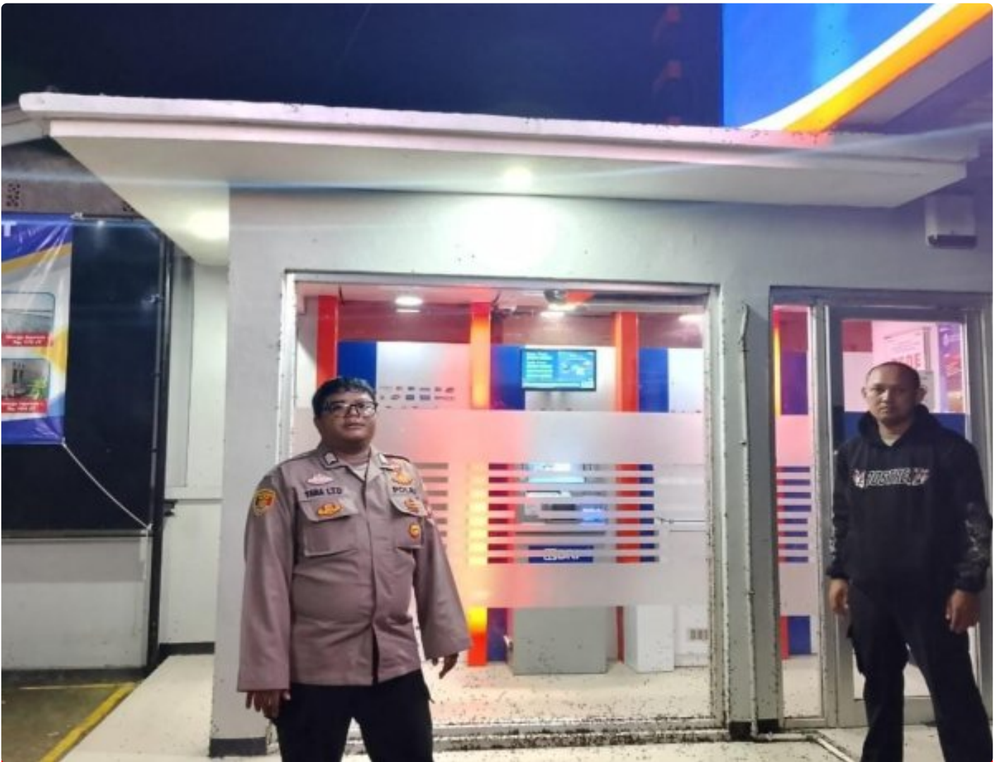
Anggota Polsek Tirtajaya Kontrol Keamanan Bank BRI Unit Pisangsambo guna mengantisipasi terjadinya Pencurian dan Pembobolan ATM